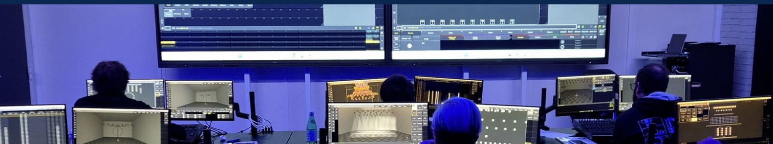
Centre Oliverdy — présentiel · 1 console grandMA3 command wing par participant · Pour le niveau 1